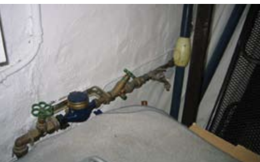
In jede Trinkwasseranlage muss eine Sicherungsarmatur gegen Rückfließen eingebaut sein. Hier fehlt sie.

Manch selbsternannter Energieberater empfiehlt ahnungslosen Eigenheimbewohnern, die Zirkulationspumpe als Energiefresser einfach abzuschalten oder die Leitung am Warmwasserbereiter abzuklemmen. Die Folgen einer solchen „Beratung“ können meterlange undurchflossene Leitungen sein. In diesem stehenden Wasser (auch als Stagnationswasser bezeichnet) können sich Keime