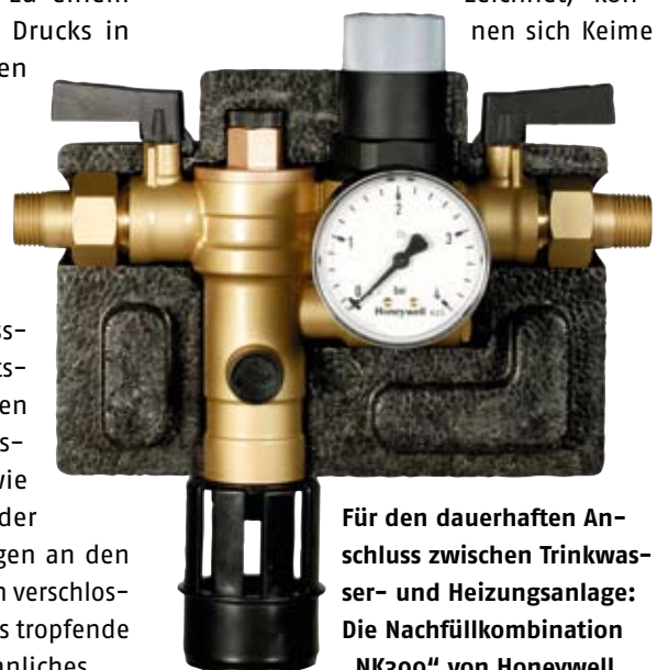
Für den dauerhaften Anschluss zwischen Trinkwasser- und Heizungsanlage: Die Nachfüllkombination „NK300“ von Honeywell.