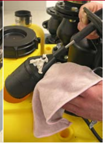
■ Bild 6: Überprüfung und Säuberung des Laufrades und des Schwimmers.