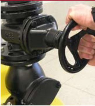
■ Bild 4: Überprüfung der Schieber-Funktionalität.

Bei der Installation einer Hebeanlage muss gewährleistet sein, dass sie auftriebsicher und mit einem zugänglichen Abstand von 60 cm rundherum installiert wird. Der Installationsort muss ausreichend beleuchtet sein und ein Pumpensumpf ist für die Raumentwässerung vorzusehen. Hierdurch kann austretendes Abwasser, das z. B. bei der Wartung anfällt, problemlos gesammelt und durch eine Handpumpe entsorgt werden.