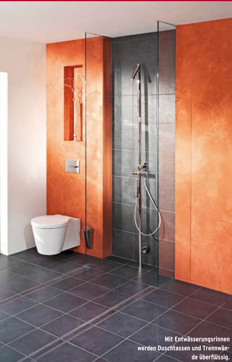
Mit Entwässerungsrinnen werden Duschtassen und Trennwände überflüssig.