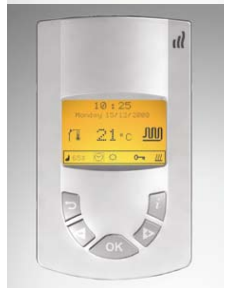
Bild 2: Elektronischer Raumtemperaturregler. Über ihn stellt der Nutzer seine gewünschte Raumtemperatur ein. Je nach Kundenwunsch stehen Standardregler (oben) und Komfortregler zur Verfügung (unten).